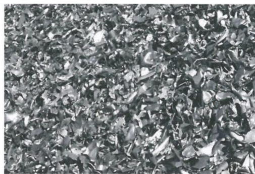
图 A.8 破碎型再生钢铁原料 SRS 403