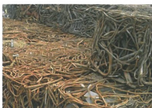
图 A.10 包块型再生钢铁原料 BRS502