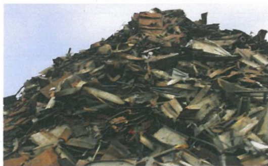
图 A.1 重型再生钢铁原料 HRS101