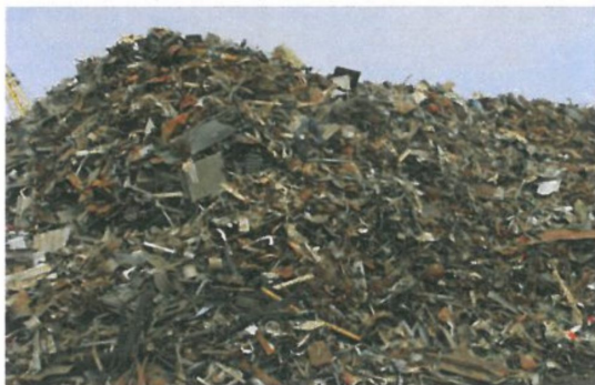
图 A.3 中型再生钢铁原料 MRS201