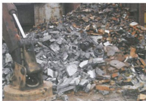
图 A.12 铸铁再生钢铁原料 CRS701