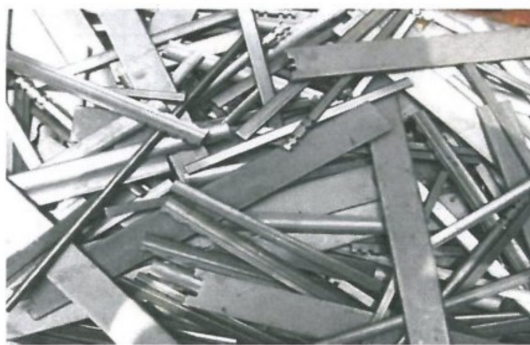
图 A.11 合金钢再生钢铁原料 ARS601/ARS602