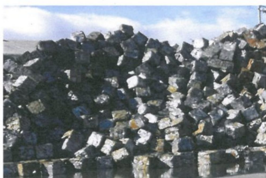
图 A.9 包块型再生钢铁原料 BRS501