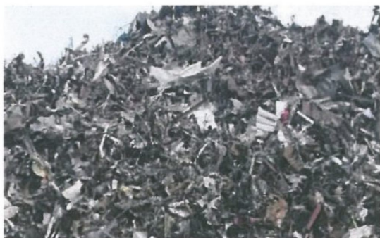
图 A.5 小型再生钢铁原料 LRS301