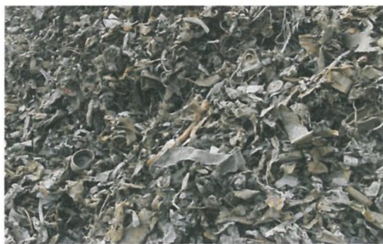
图 A.7 破碎型再生钢铁原料 SRS401/402