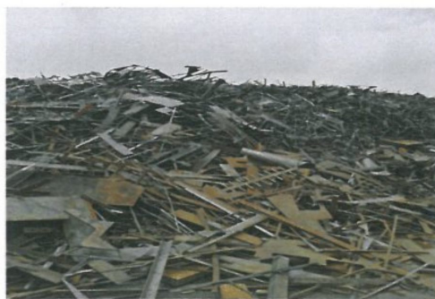
图 A.2 重型再生钢铁原料 HRS102