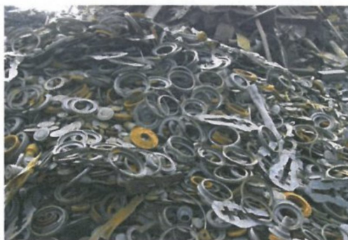
图 A.4 中型再生钢铁原料 MRS202