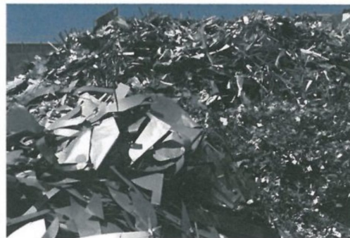
图 A.6 小型再生钢铁原料 LRS303